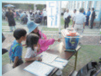
ミニモデルの説明