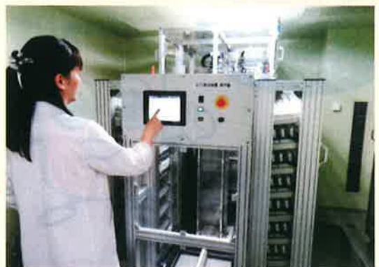
自動測定機で測定しBODを算出