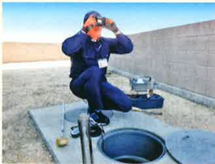
(現場での水質検査)