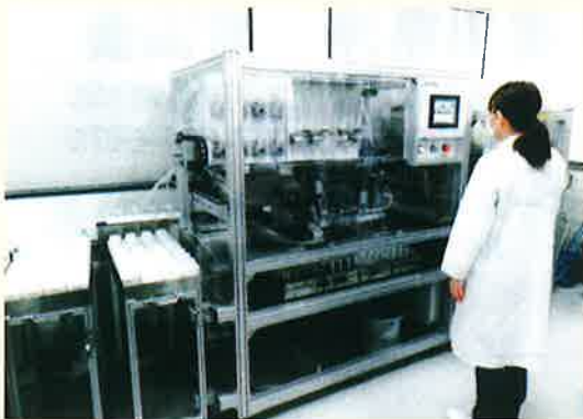
試料の希釈、調整作業